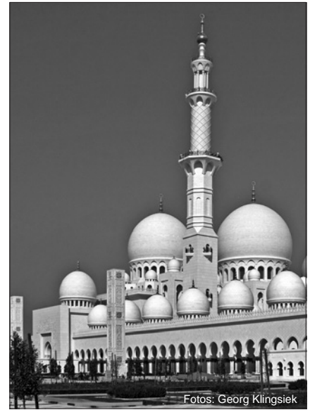
Vom Minarett, das zu jeder Moschee gehört, ruft der Muezzin zum Gebet – heute über Lautsprecher.

Der Islam gibt den Gläubigen konkrete Anweisungen für ihre Lebensführung. Der Glaube bestimmt alle Bereiche des Lebens. Die Scharia (arab.: Weg zur Tränke) regelt die religiösen Pflichten, ersetzt in einigen Ländern aber auch das zivile Strafrecht und wird dort auch gegen Nichtmuslime angewandt.